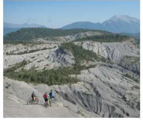
LES TERRES NOIRES