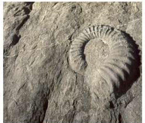
LA DALLE AUX AMMONITES