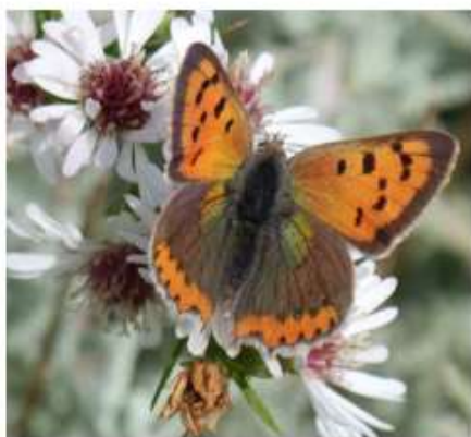
LE SENTIER DES PAPILONS