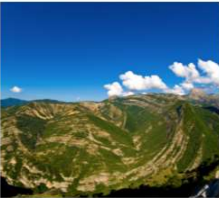
LE VIEIL ESCLANGON

L'UNESCO Géoparc de Haute-Provence a été le 1er Géoparc au monde reconnu par l'UNESCO en 2000 : Il a servi de modèle à 140 autres Géoparc répartis dans le monde entier.