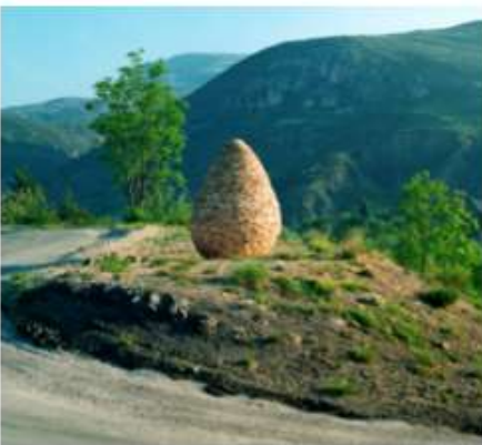
LES REFUGES D'ART