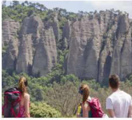
LES PÉNITENTS DES MÉES