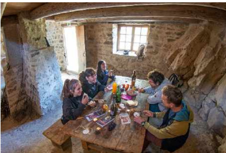
En haut : dans le refuge d'art du col de l'Escuichière. En bas à gauche : déjeuner dans le refuge d'art du Vieil Esclangon. En bas à droite : le palindrome de herman de vries.