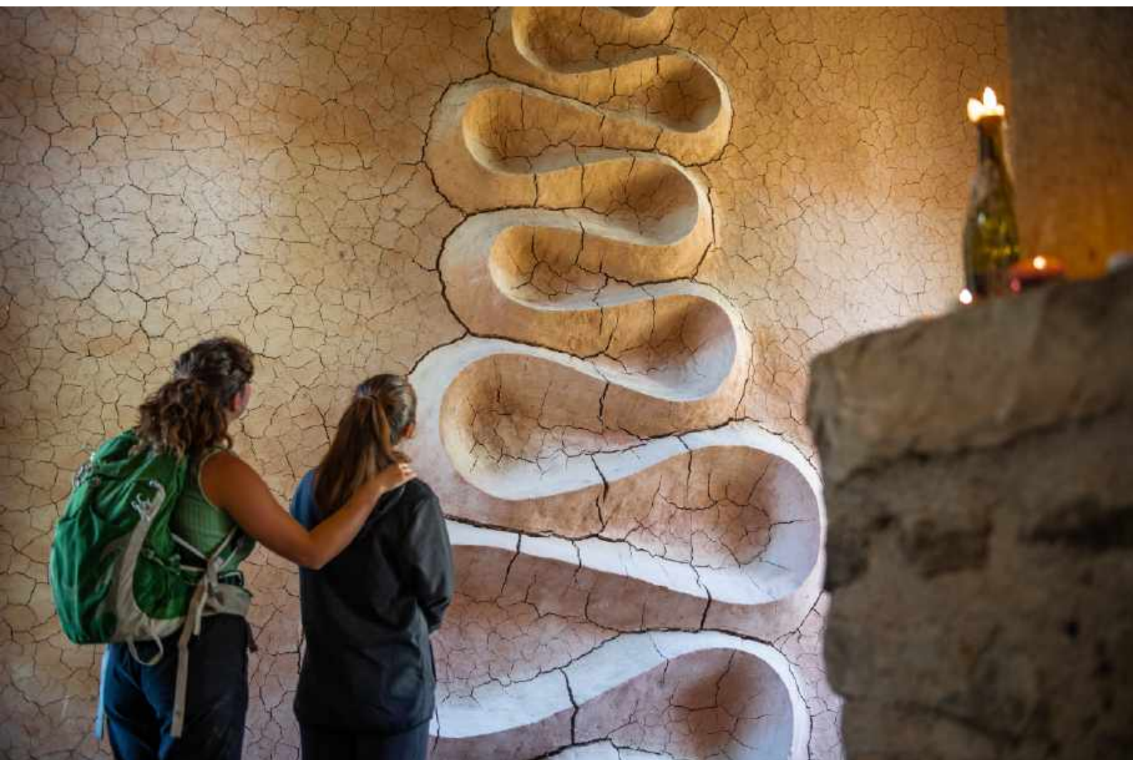
Andy Goldsworthy, refuge d'art du Vieil Esclangon

4 dates en 2024 : 26-31 mai / 25-30 juin / 30 septembre-5 octobre / 12-17 octobre