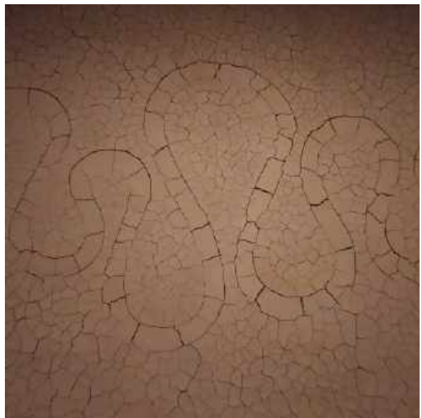
Page précédente : Le Cucuyon et le Couard depuis la Ferme Bellon ; près du Vieil Esclangon. Cette page, de haut en bas : la sentinelle du Vançon ; refuge d'art du col de l'Escuichières ; la dalle aux ammonites, vestige d'un fond marin il y a deux cent millions d'années ; refuge d'art de La Forest ; River of Earth.