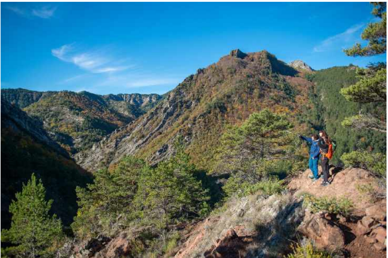
Sur le sentier qui monte vers le Vieil Esclangon

* Nous pouvons être amenés à modifier l'itinéraire indiqué : soit au niveau de l'organisation (problème de surcharge des hébergements, modification de l'état du terrain, éboulements, sentiers dégradés, etc.), soit directement du fait du guide (météo, niveau du groupe, etc.). Ces modifications sont toujours faites dans votre intérêt, pour votre sécurité et pour un meilleur confort.